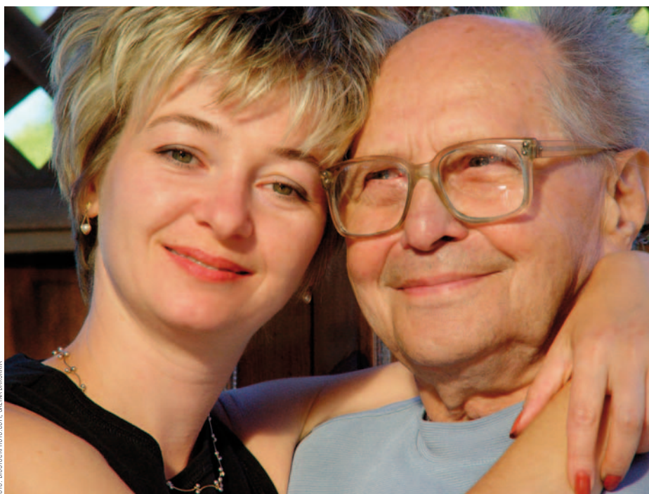
Vaak zal het de begeleider zijn die de persoon aanmoedigt en daadwerkelijk ondersteunt.

Begeleiders hebben in de voorbije decennia naast de persoonlijke ontplooiing, veel aandacht besteed